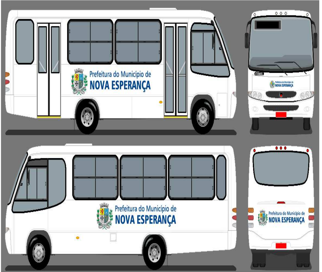
IMAGEM 01 MICRO-ÔNIBUS: