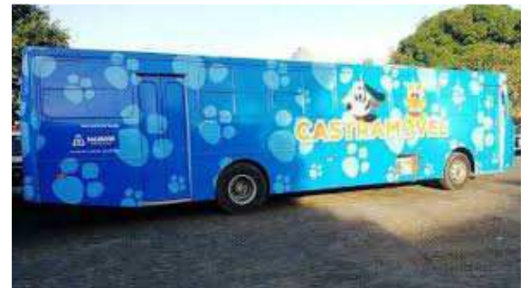
Modelo de plotagem