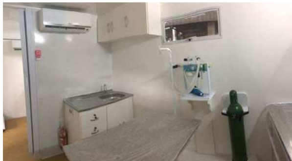
Modelo de design de consultório