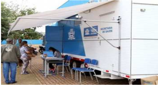
Modelo de trailer