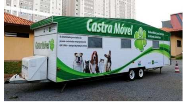
Modelo de trailer