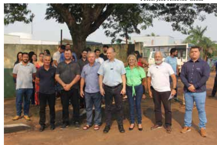
Lideranças locais receberam o Deputado Federal e atual Secretário de Indústria, Comércio e Serviços do Estado do Paraná, Ricardo Barros