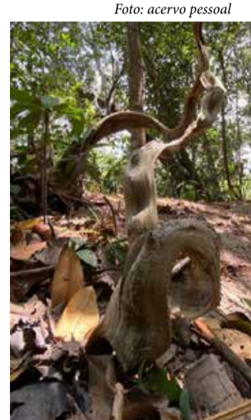
Escada - de - Jabutí ou Pata - de - Vaca por causa de suas folhas, é um cipó típico das florestas da América Latina.

E o Gavião-vermelho em brasa paira rente ao solo foge do impiedoso sol