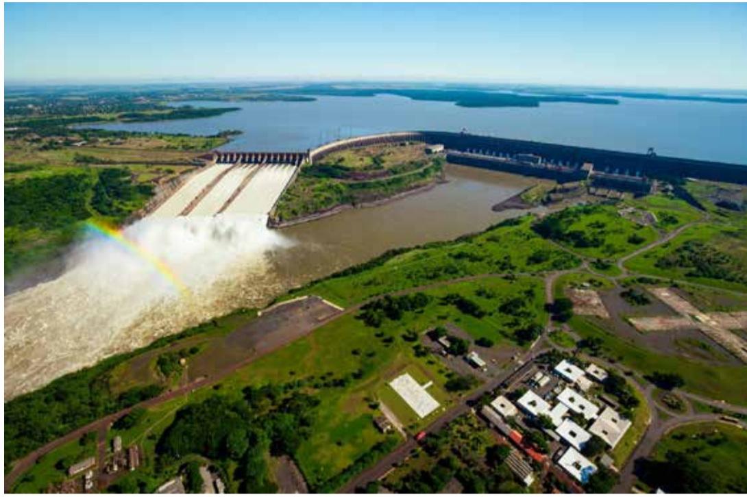
Usina de Itaipu: líder na transição energética.