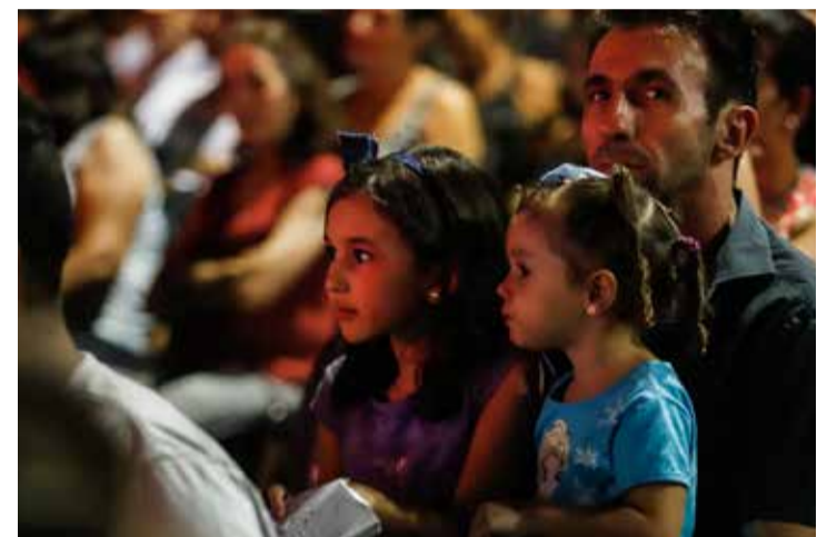
A expectativa é grande para a chegada do "Cinema na Praça" em Presidente Castelo Branco. Um carro de som percorrerá as ruas da cidade avisando sobre o evento, convidando a todos para participarem dessa noite mágica

A iniciativa reforça o compromisso do Governo do Paraná com o acesso à cultura e à inclusão social, levando cinema e diversão para todos, sem deixar ninguém para trás.