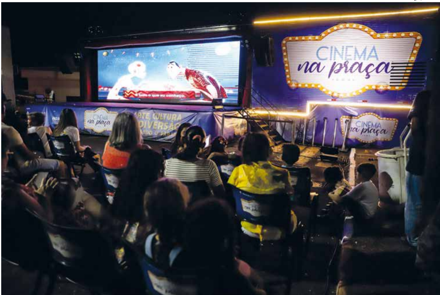
"Cinema na Praça" leva, nesta próxima sexta-feira (27), a magia da sétima arte a Presidente Castelo Branco

Na próxima sexta-feira, 27 de setembro, a cidade de Presidente Castelo Branco será transformada em um grande espaço de entretenimento e cultura com a chegada do projeto itinerante "Cinema na Praça". A iniciativa,