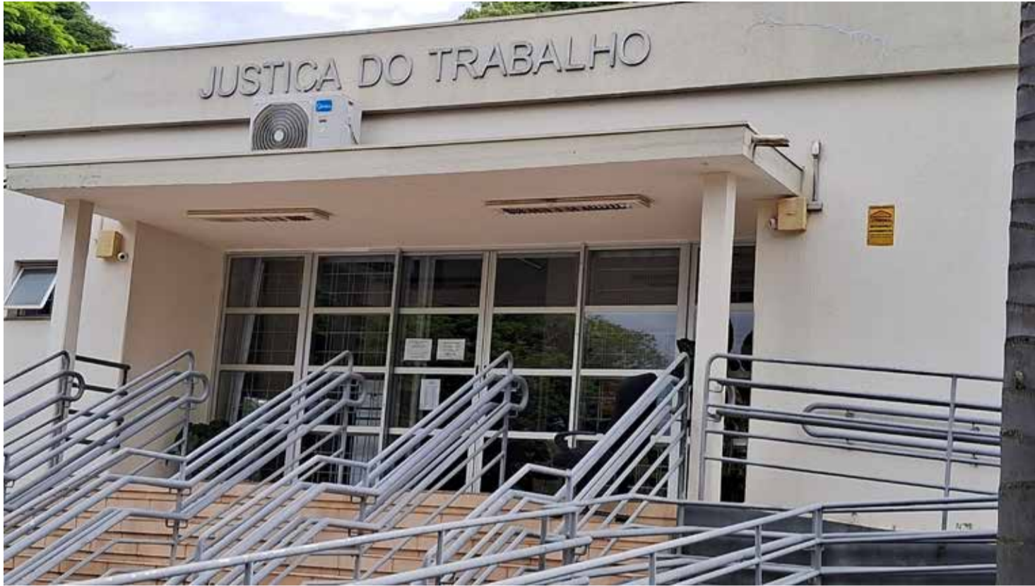
Vara do Trabalho de Nova Esperança: 8ª edição da Semana Nacional da Conciliação Trabalhista acontece nacionalmente no mês de maio

A Justiça do Trabalho de Nova Esperança pretende aumentar os índices de acordos amigáveis durante a 8ª edição da Semana Nacional da Conciliação Trabalhista, que acontece nacionalmente no mês de maio. Em 2023, 67 pessoas foram atendidas na Vara do Trabalho da cidade. O esforço resultou no pagamento de R$ 120,5 mil em indenizações, referentes a seis processos. O mutirão neste ano acontece entre os dias 20 e 24 de maio e as inscrições para mediação devem ser realizadas até 10 de maio no site do Tribunal Regional do Trabalho da 9ª Região (TRT-PR): www.trt9.jus.br .